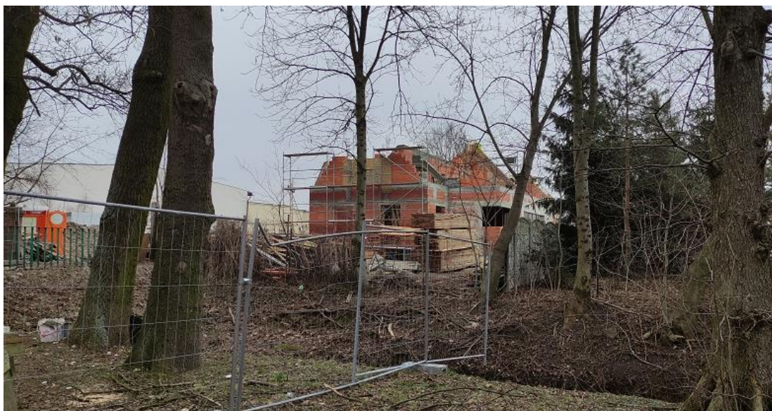
Ryc. 1. Budowa Domu Włodarza

elektrycznej, teletechnicznej, gazowej. Przedsięwzięcie ukierunkowane jest także na adaptację przebudowanej i rozbudowanej infrastruktury na cele aktywności kulturalnej oraz integracji społecznej, a zatem w jego ramach planuje się także zakup niezbędnych środków trwałych i wyposażenia. Dzięki powyższemu prace budowlane ruszyły w roku 2021.